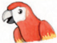
der Papagei el loro