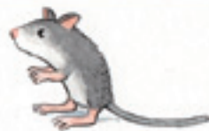
die Wüstenrennmaus el jervo