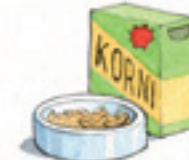
das Körnerfutter las semillas