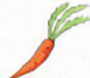
die Karotte la zanahoria