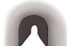
der Tunnel туннель