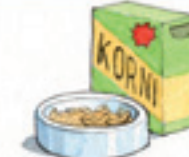
das Körnerfutter Dendikê