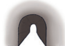
der Tunnel tunelul