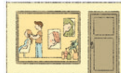
der Friseursalon salonul de coafură