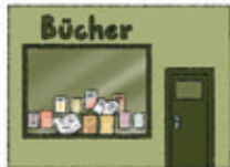
der Buchladen librăria