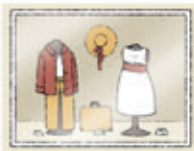
das Schaufenster vitrina