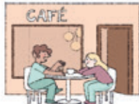
das Café cafeneaua