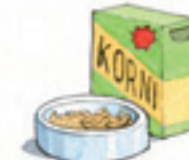
das Körnerfutter il mangime a base di semi