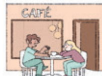
das Café qehwexane