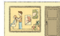
der Friseursalon sertiraşxane