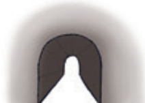
der Tunnel tûnêl