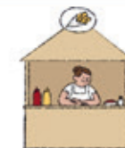
die Imbissbude xwaringeha xwarinên lezgîn