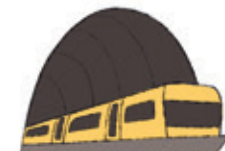
die U-Bahn subway