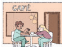
das Café coffee shop