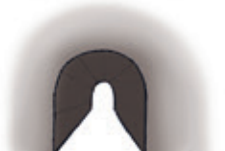
der Tunnel tunnel