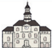
das Rathaus city hall