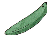
die Gurke cucumber