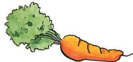
die Karotte carrot