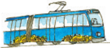
die Straßenbahn tramvay