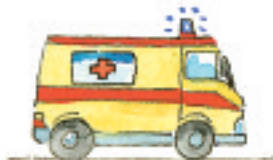
der Krankenwagen ambulans