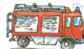
das Feuerwehrauto itfaiye aracı