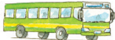
der Bus otobüs