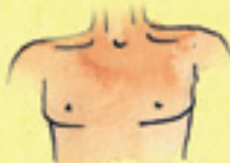
die Brust piers