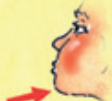
das Kinn broda