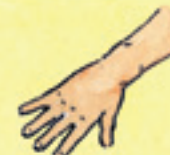
die Hand dłoń