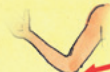
der Ellenbogen łokieć