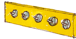
die Garderobe portmanto