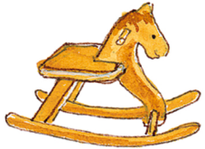
das Schaukelpferd tahta at