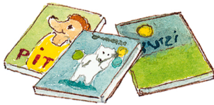
die Bücher (pl.) kitaplar