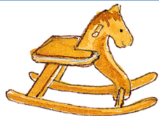
das Schaukelpferd el caballo balancín