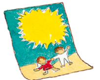
das Poster el póster