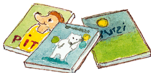
die Bücher (pl.) los libros