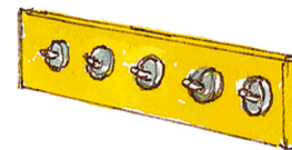
die Garderobe el perchero