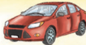
das Auto el coche