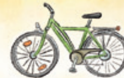
das Fahrrad la bicicleta