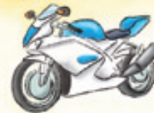
das Motorrad la moto