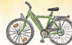
das Fahrrad bicycle/bike