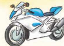
das Motorrad motorcycle