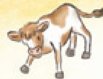
das Kalb el ternero