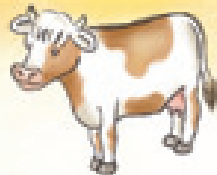
die Kuh la vaca