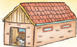
der Stall el establo