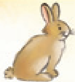
das Kaninchen el conejo