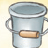
der Eimer el cubo