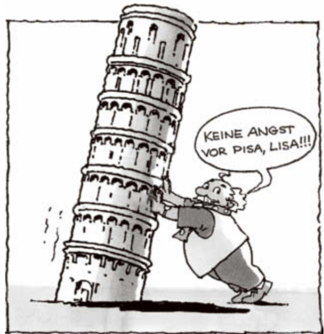
Kugelblitz rückt das gerade!

Zu den Lehrplänen der Fächer Deutsch, Sachunterricht und Mathematik ergeben sich zahlreiche motivierende Anknüpfungspunkte. Angeregt durch die spannenden Ereignisse in den Ratekrimis schreiben, rechnen, malen, forschen, basteln und spielen die Nachwuchsdetektive. Nachdem sie sich anfangs eine Detektivausrüstung zugelegt haben (siehe Seite 4/5), werden sie am Ende ermuntert, einen eigenen kleinen Kugelblitz-Krimi zu verfassen, und können beim Kugelblitz-Würfelspiel ihr detektivisches Wissen anwenden.