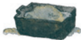
der Mörtel zaprawa