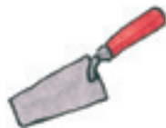
die Maurerkelle la cazzuola