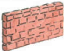
die Mauer il muro