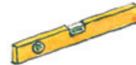
die Wasserwaage la livella a bolla