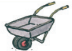
die Schubkarre la brouette