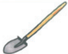
die Schaufel la pelle