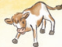
das Kalb golik