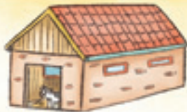
der Stall axur