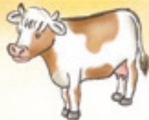
die Kuh çêl