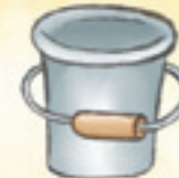
der Eimer dewlik