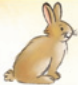
das Kaninchen kêvroşk