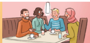
◆ der Freundeskreis