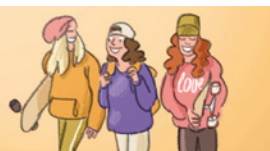
◆ die Clique