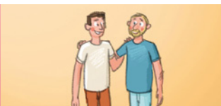
◆ die Freundschaft