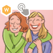
◆ die Freundin / ◆ der Freund

+ SCHON FERTIG? Sprechen Sie über weitere Personen aus Ihrem Baum.