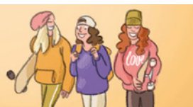
◆ die Clique