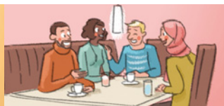
◆ der Freundeskreis