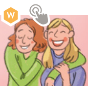
◆ die Freundin / ◆ der Freund

+ SCHON FERTIG? Sprechen Sie über weitere Personen aus Ihrem Baum.