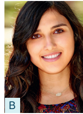
B Alba aus Spanien

In Deutschland darf man nicht einfach seine Freunde zu einer Einladung mitbringen. Das üb e r r a s c h t mich. In Brasilien nimmt man öfter jemanden mit. Aber man fragt vorher.