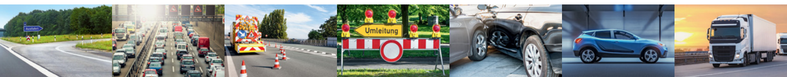
◆ die Ausfahrt ◆ der Stau ◆ die Baustelle ◆ die Umleitung ◆ der Unfall ◆ der Pkw ◆ der Lkw