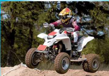
Mit dem Quad